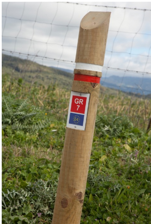
▲ Señalización del GR-7

desapareciendo para ir mezclándose con Encinas, Quejigos y Acebuches.