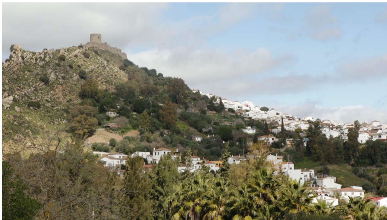
▲ Vista de la ciudad de Jimena de la Frontera desde la Pasada de Alcalá

a.C. dentro del horizonte turdetano. Lo mismo ocurre ya en el siglo I a.C. con la presencia de monedas libio-fenicias bilingües con el topónimo latino de OBA . Con la llegada de los romanos el nombre OBA pasa a latinizarse y adquiere la categoría de Municipium Res Publica Obensis durante el mandato del emperador Vespasiano. Ya en el siglo III la