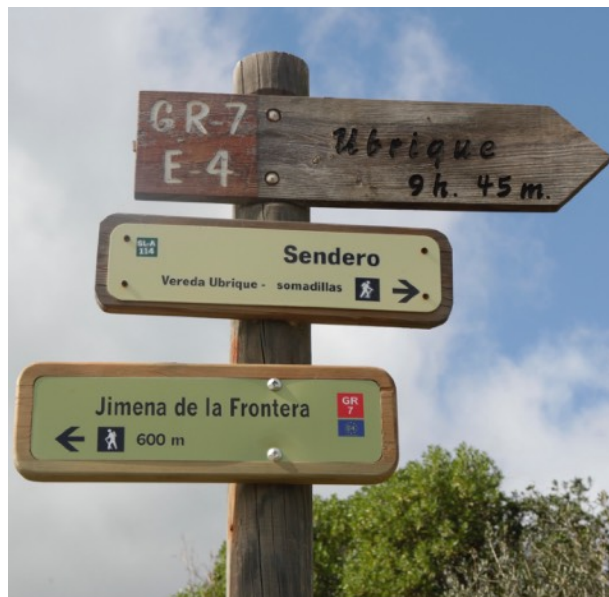
Señalización del GR-7 a su paso por Jimena de la Frontera

El sendero GR-7 (E-4) a su paso por la provincia gaditana cuenta con 9 etapas que en total suman aproximadamente 150 kilómetros: